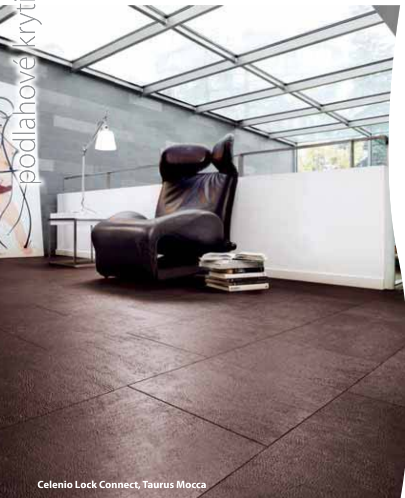
Celenio Lock Connect, Taurus Mocca