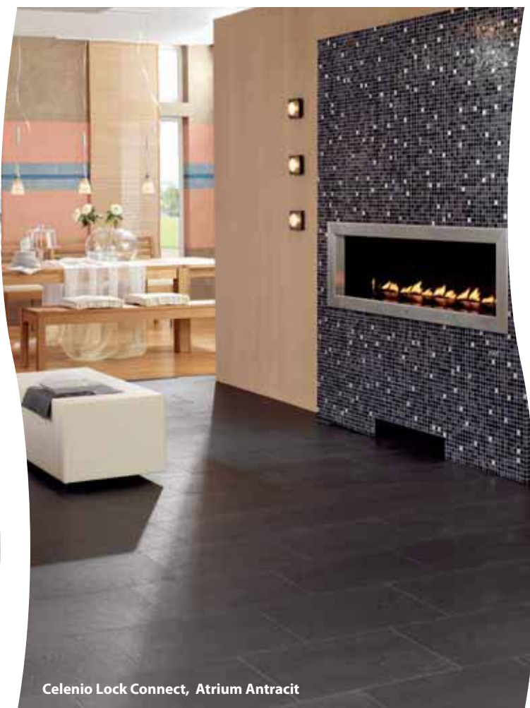
Celenio Lock Connect, Atrium Antracit