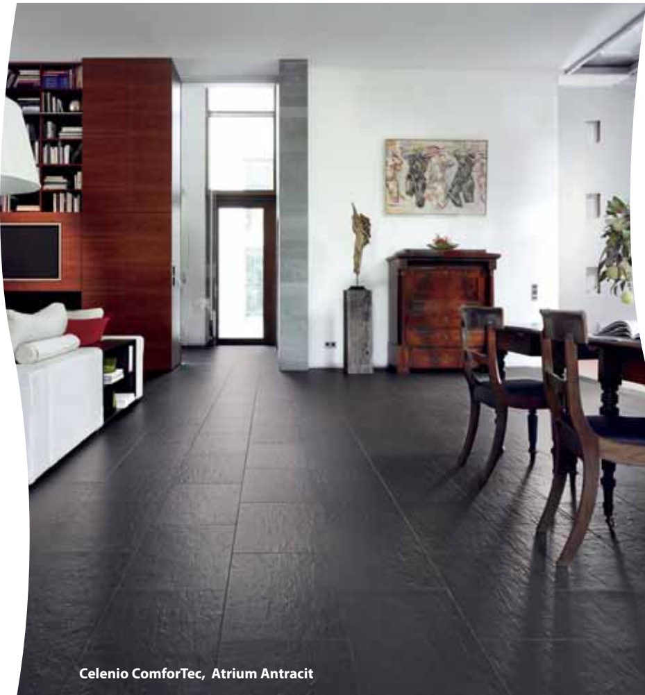
Celenio ComforTec, Atrium Antracit